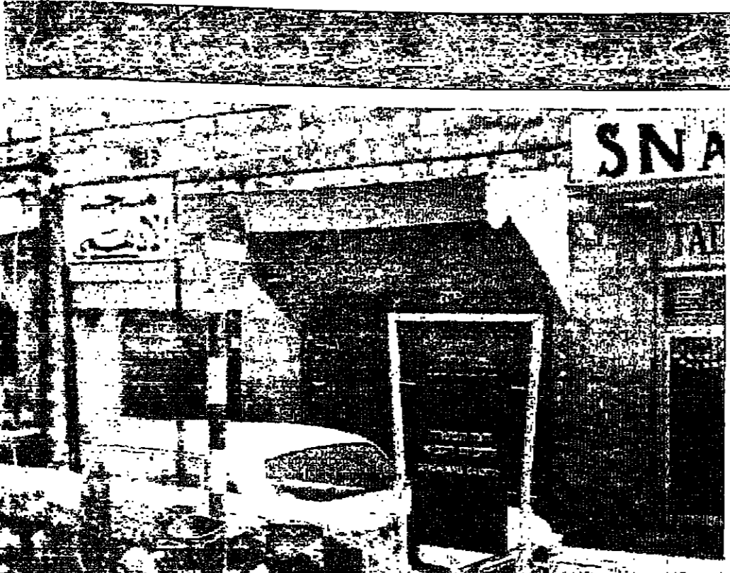
درجت السلطات الإسرائيلية على ابتداء مختلف المراكز «الدينية» للاستيلاء على البلاد العربية في القدس وتظهر في الصورة لجنة كيب على «مفارة أريحا» وهو أحد أسياد الميراثيين - وترجم السلطات الإسرائيلية ان هذا المكان مقدس ويلاحظ انهم «اخفوه» بالقرب من مسجد الاحصي في القدس وقد ذكرت الصحف الإسرائيلية انهم سيبادرون الاراضي في هذه المنطقة لبناء كنيسة يأسس النبي ارميا «صورة خاصة بالتصوير»